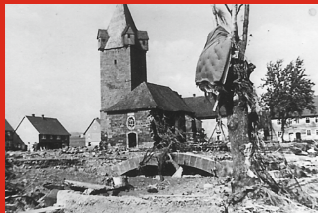
Affoldern 18.Mai 1943

Vervolging en verzet Politieke weerstand / slachtoffer en dader