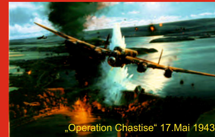
„Operation Chastise“ 17.Mai 1943

Sperrmauer Museum Edersee Dambusters Museum Germany