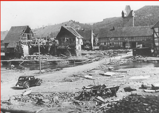
Affoldern 18.Mai 1943